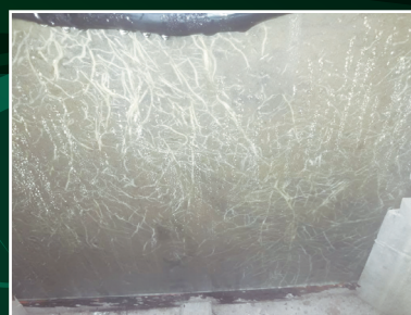
Pimiento. ACRECIO 500 cc/100 L, aplicación en drench.

1er cosecha 2/8/21: (rojo) 60 cajones. (15,40 % arriba) 2da cosecha 18/8/21 30 cajones (15,40 % arriba).