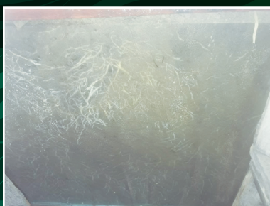
Pimiento. Testigo, vista de desarrollo radicular.

Cultivo de frutilla otoñal. Mar del Plata 2021.